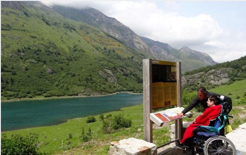
Sentier d'interprétation du Tech