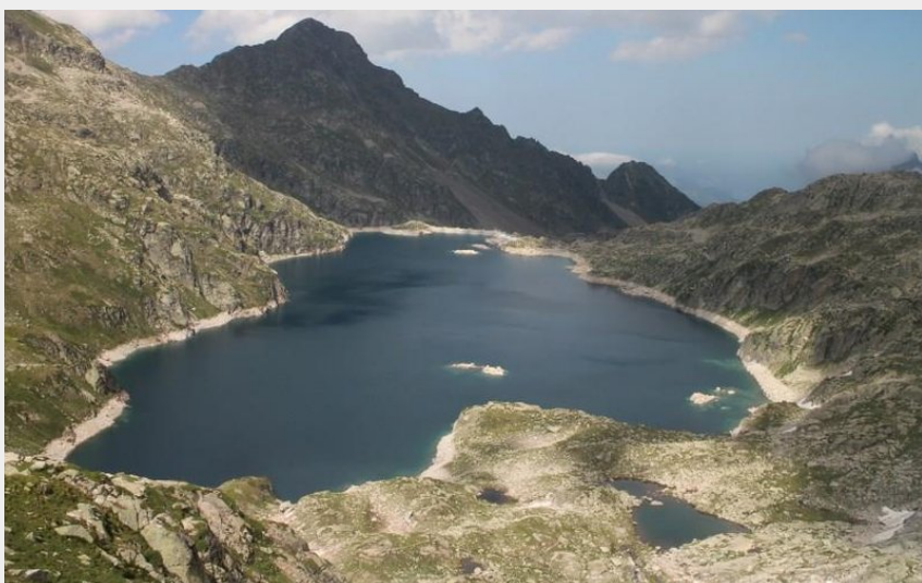
Le lac de Migouélou (Manon Vallin)