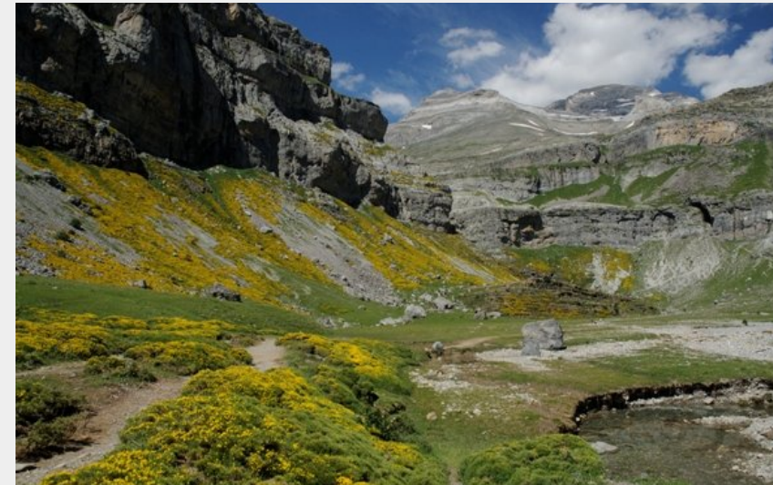
La cola de caballo