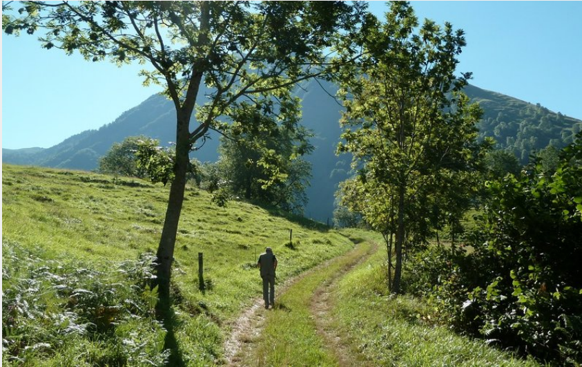
La Prade d'Isaby