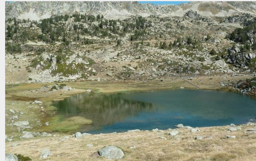
Lac de Coueyla-Gran