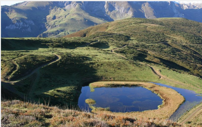
Le lac de Soum et le massif du Gabizos