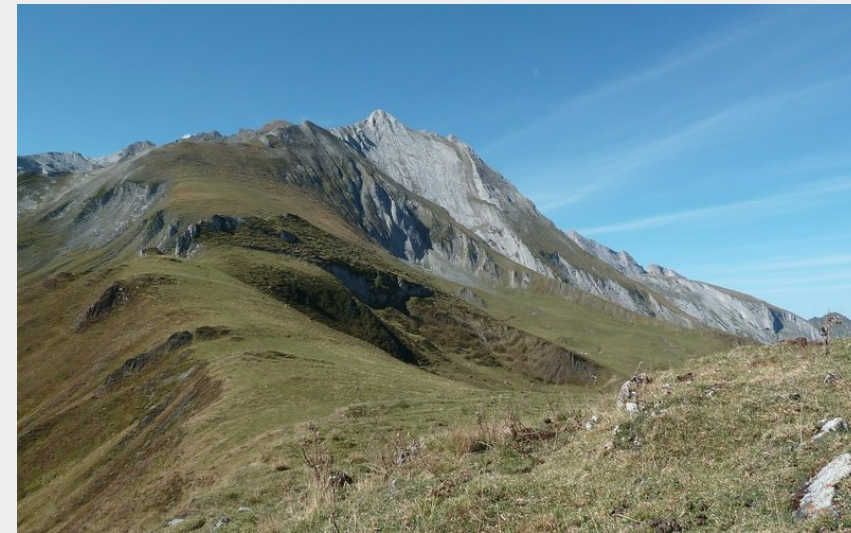
Les crêtes de Surgatte