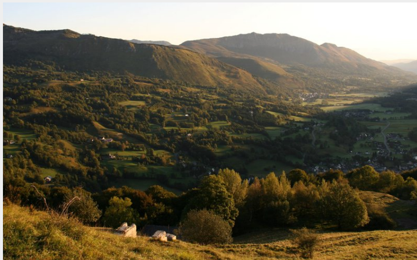
Vue sur la vallée depuis le belvédère