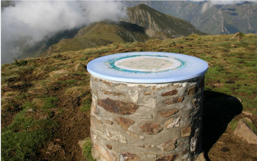
Table d'orientation au sommet du Cabaliros