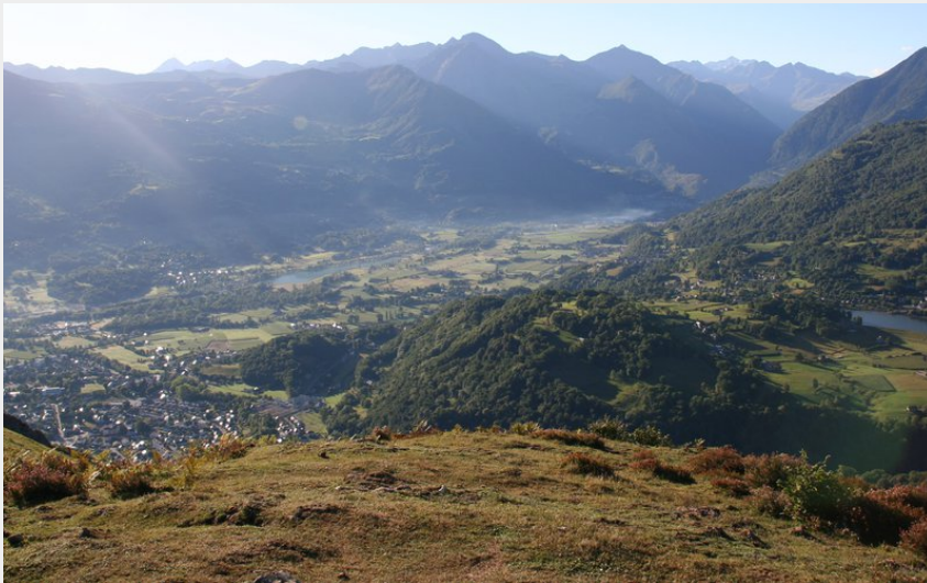
Vue sur la vallée d'Argelès-Gazost depuis le sommet