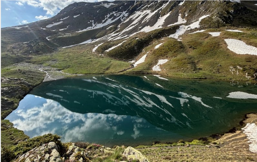
Le lac de Bassia