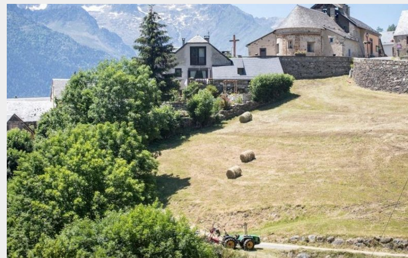
Village de Sers