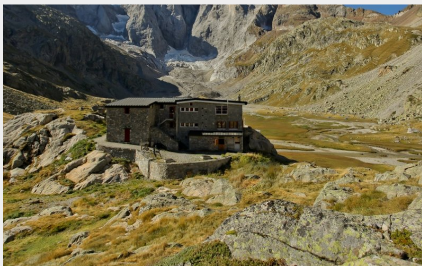
Reuge des Oulettes de Gaube et face nord du Vignemale