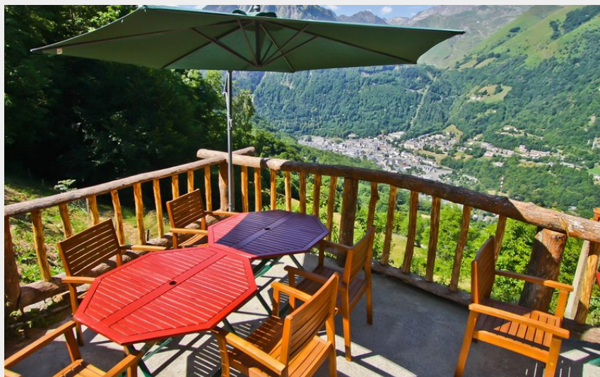
Panorama depuis le chalet de la Reine Hortense