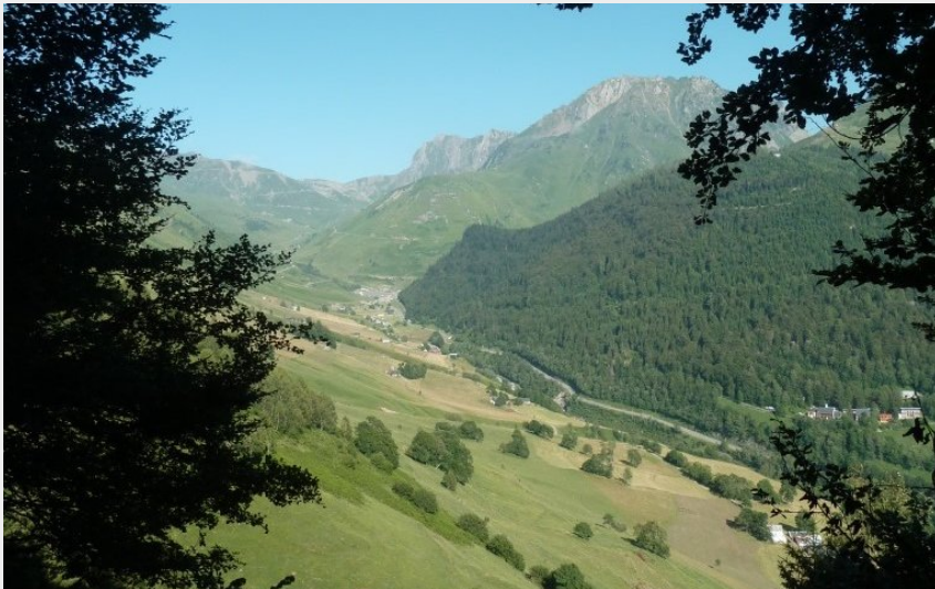
Vue sur Souriche et la vallée du Tourmalet