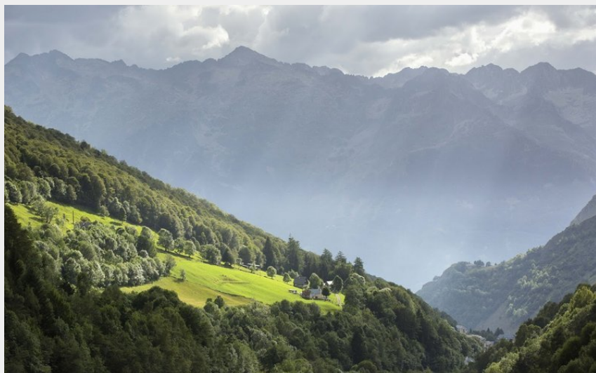
La vallée de Barèges