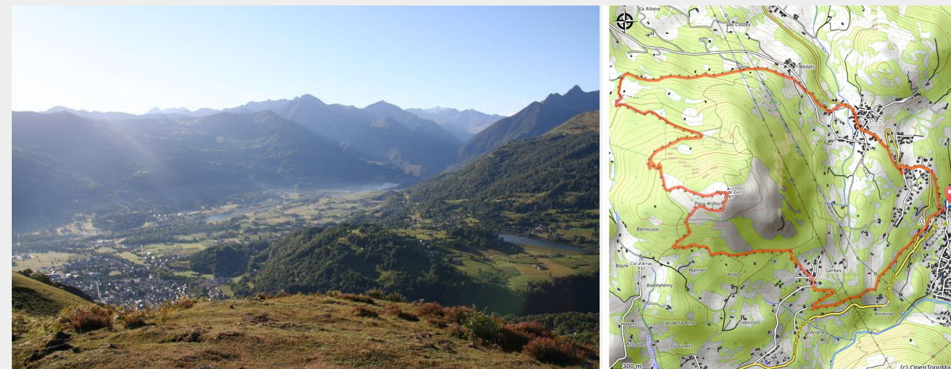
Panorama sur la vallée d'Argelès-Gazost

Vallée d'Argelès-Gazost / Hautacam - Argelès-Gazost