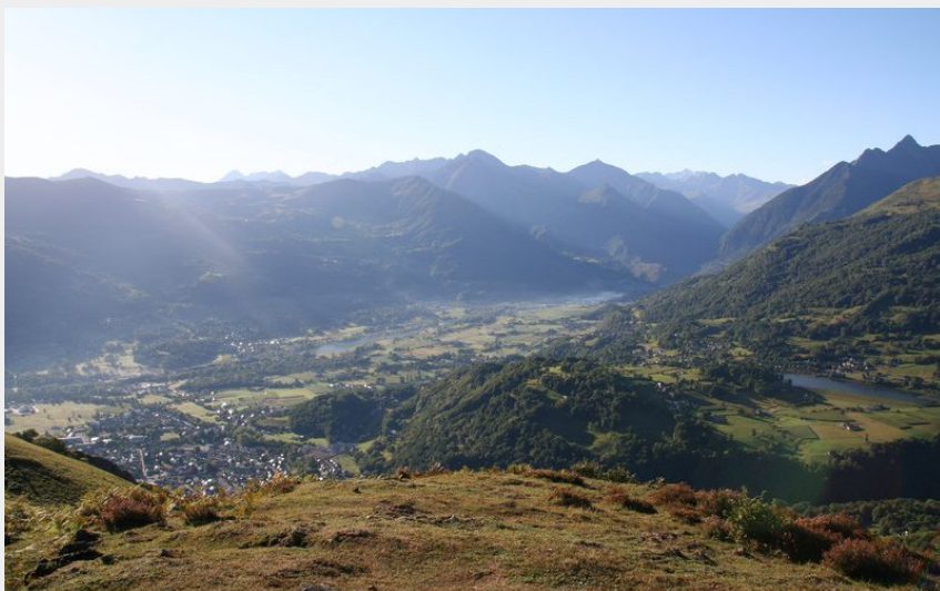
Panorama sur la vallée d'Argelès-Gazost