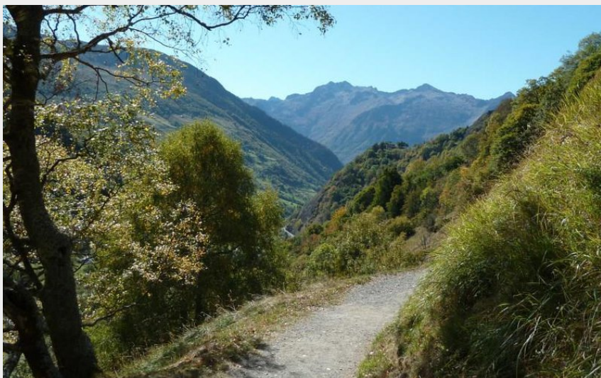
Sentier de la croix Saint-Justin