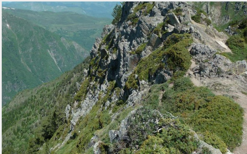
Le Pic du Viscos depuis les crêtes