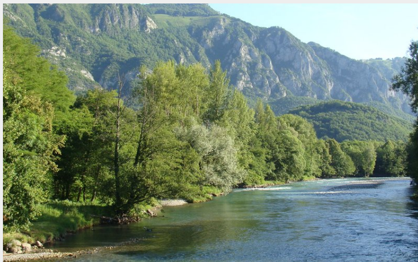
Le gave de Pau depuis le pont de Boû-Silhen