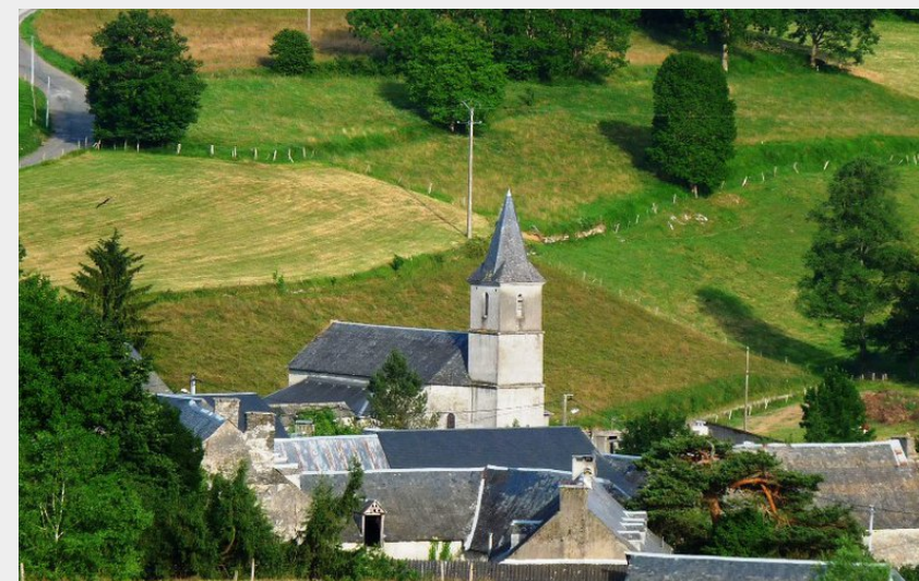
Labastide (OT Coeur des Pyrénées)