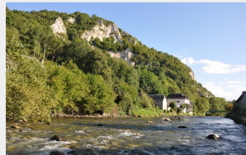
la Neste (OT Cœur des Pyrénées)