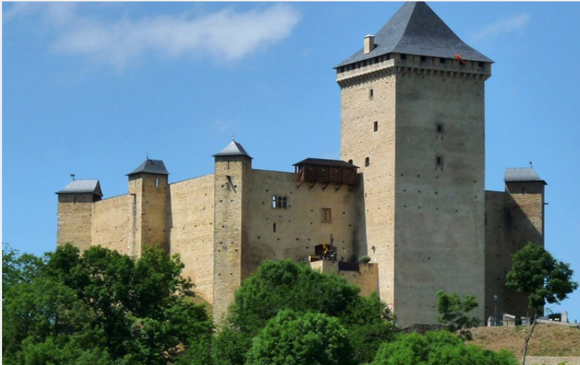
Château de Mauvezin