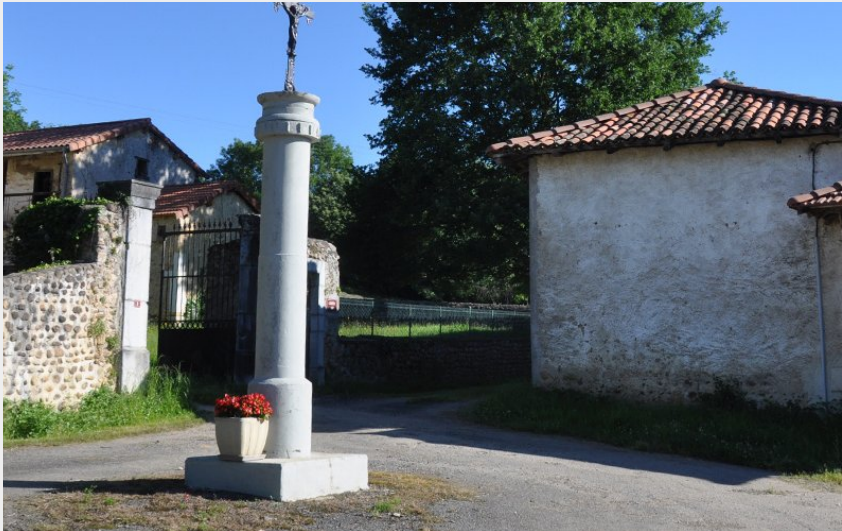
Village d'Arné