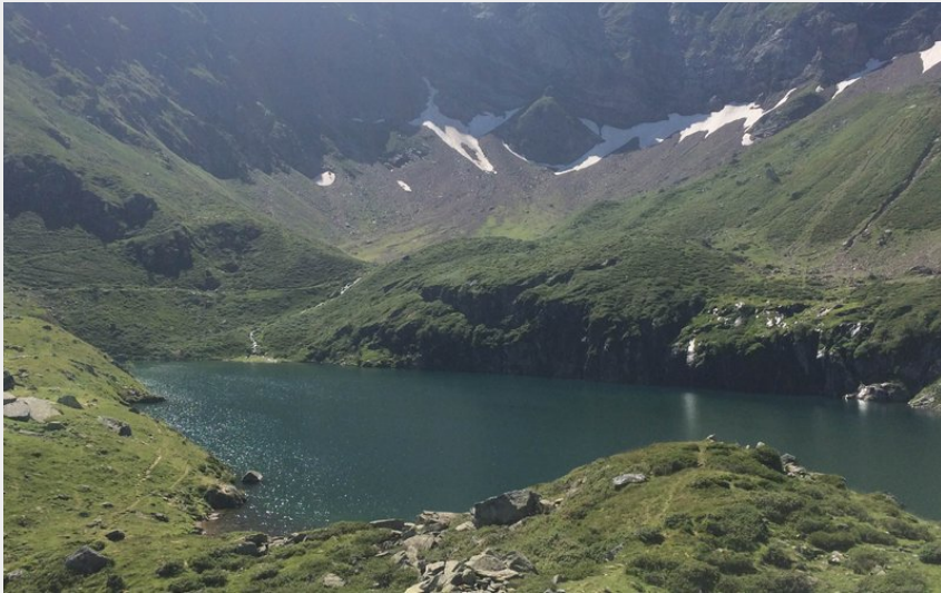
lac de Peyrelade (@tourmaletpicdumidi)