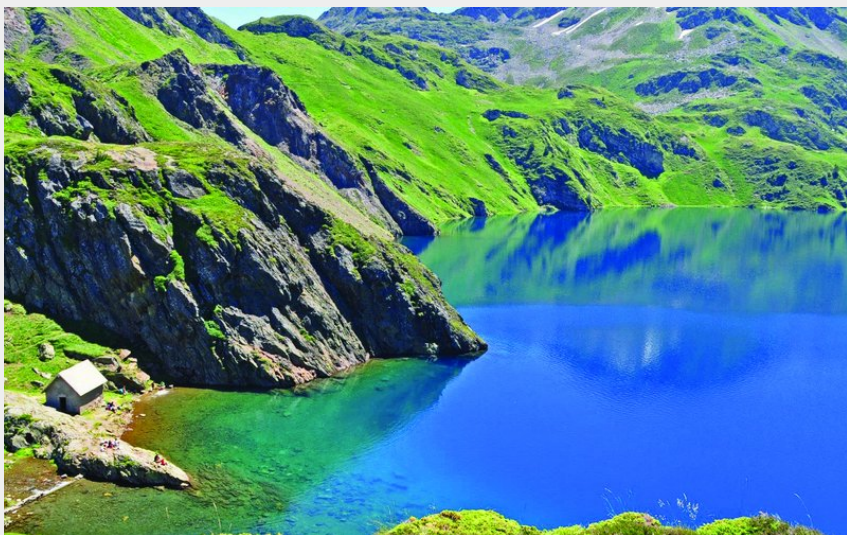
lac Bleu