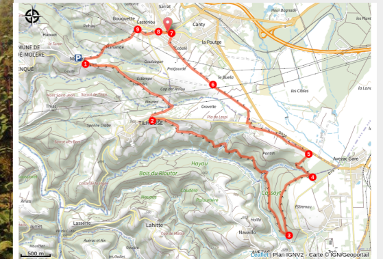
Le chemin des Tumulus

Le chemin serpente le long de l'antique Ténarèze, l'une des plus anciennes voies de circulation des Pyrénées. Ici, l'histoire se fond dans le paysage: tumulus énigmatiques, sous bois paisibles et en toile de fond, la chaîne montagneuse.