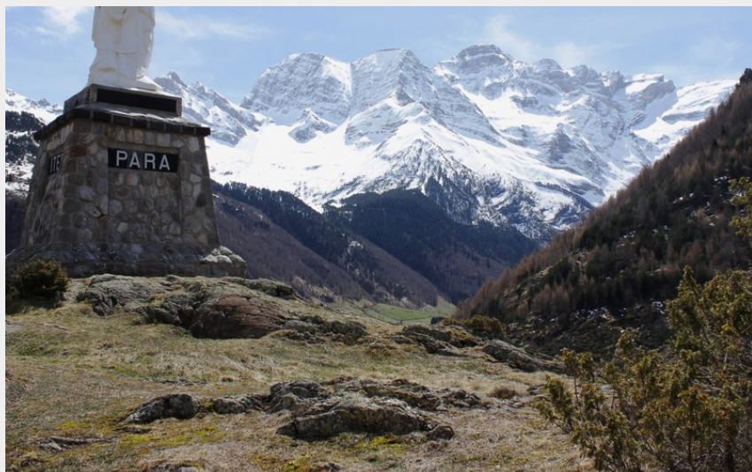
Panorama sur les Astazous et le massif du Marboré