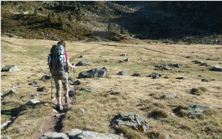
A l'approche du refuge