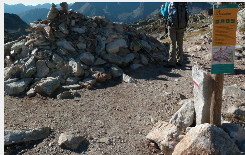
Le col de Madamète