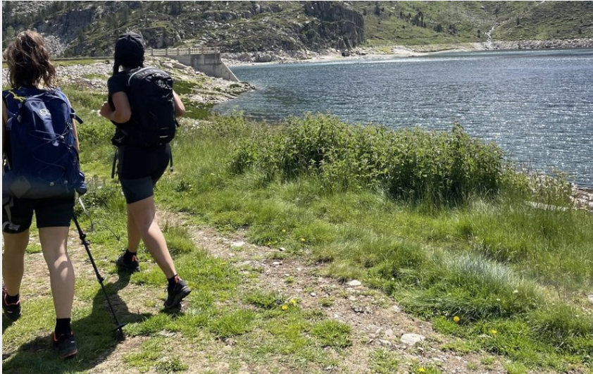
Au bord du lac