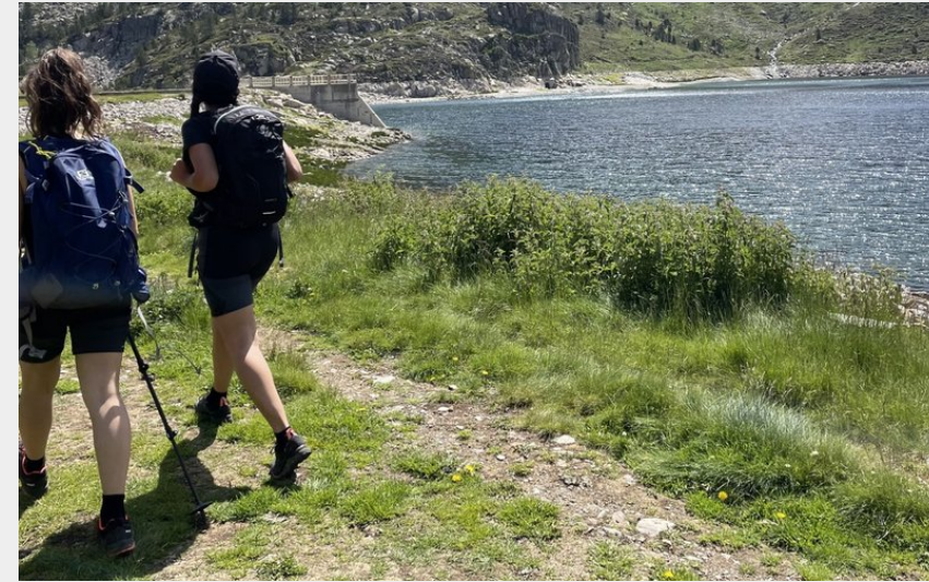
Au bord du lac