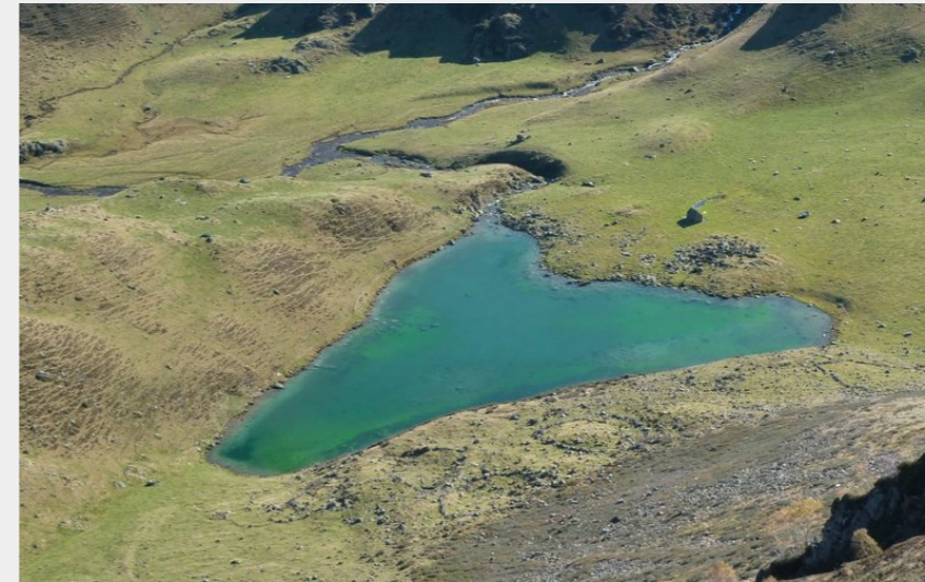
En forme de coeur... ((c) Julien Liron)