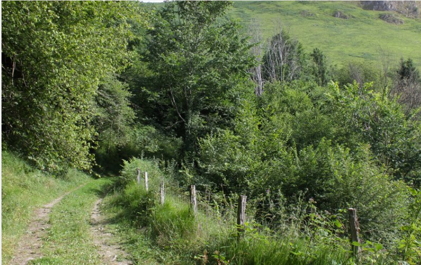
Entre bosquets et points de vue