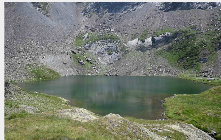
Le lac de Maucapéra