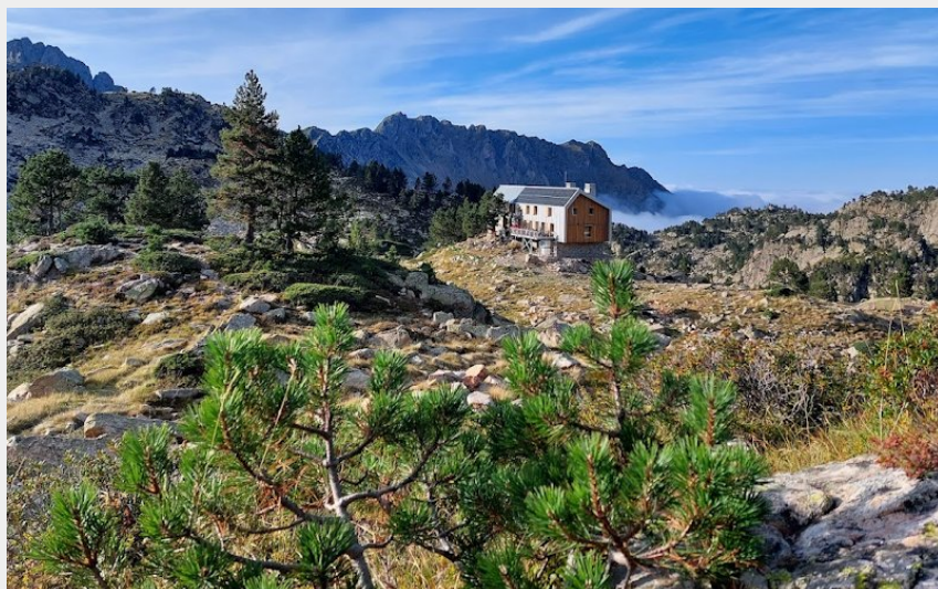
refuge de Campana de Cloutou (@PHILIPPEBRAUD)