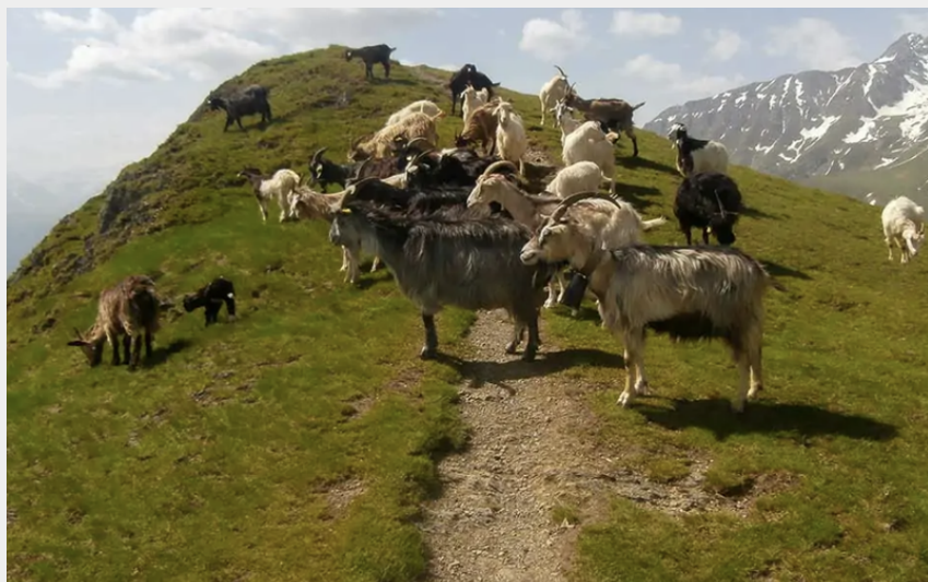
Bêtes au Plo del Naou (OT TPM)