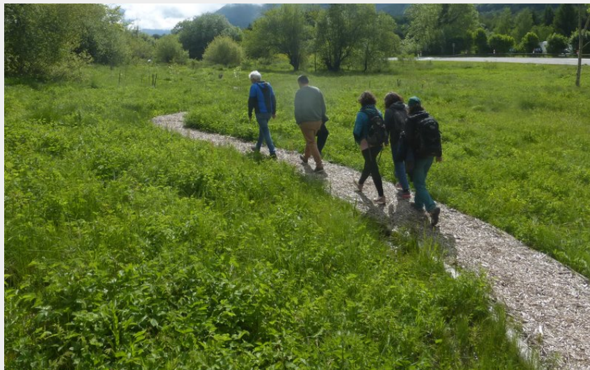
La prairie humide de la Hiasse