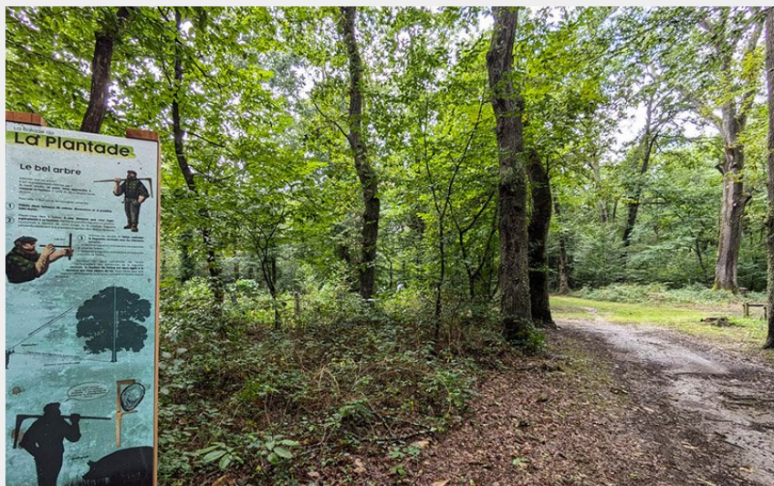
Sentier d'interprétation de la Plantade (OT Coeur des Pyrénées)