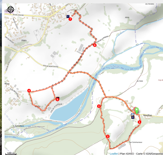
Le Sentier d'interprétation " La Neste". Vue depuis le château de La Barthe de Neste (OT Coeur des Pyrénées)