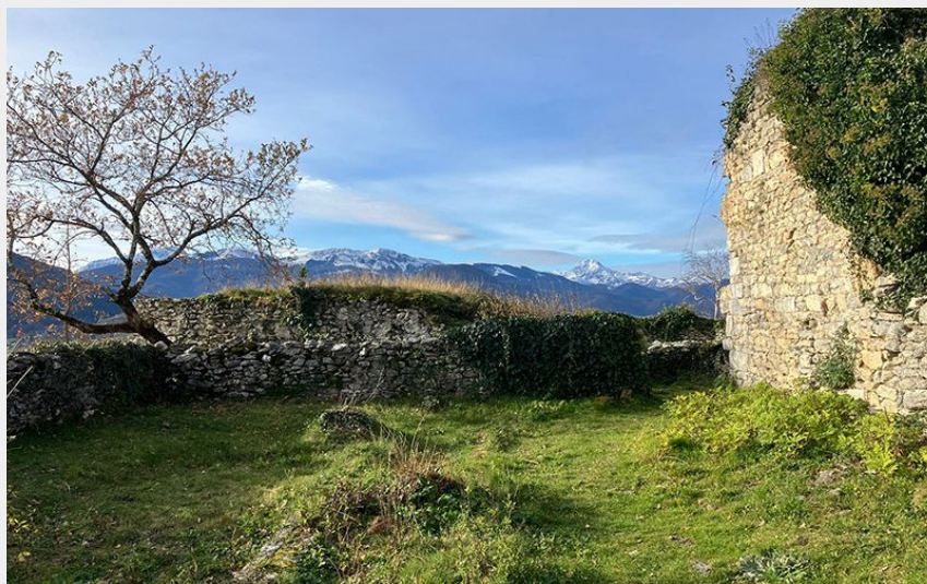
Le Château de Montoussé