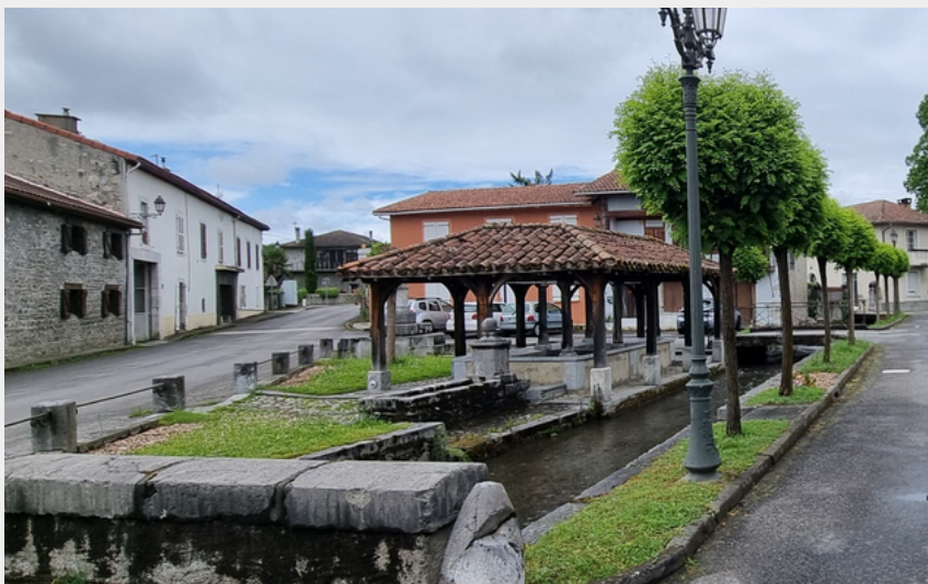
Place de St-Paul à Mazères-de-Neste (CCNB)