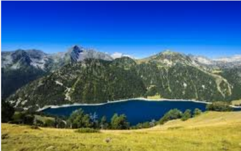
(Lac de l'Oule)