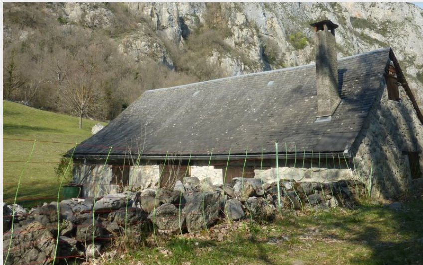
Grange au lieu-dit Ambat