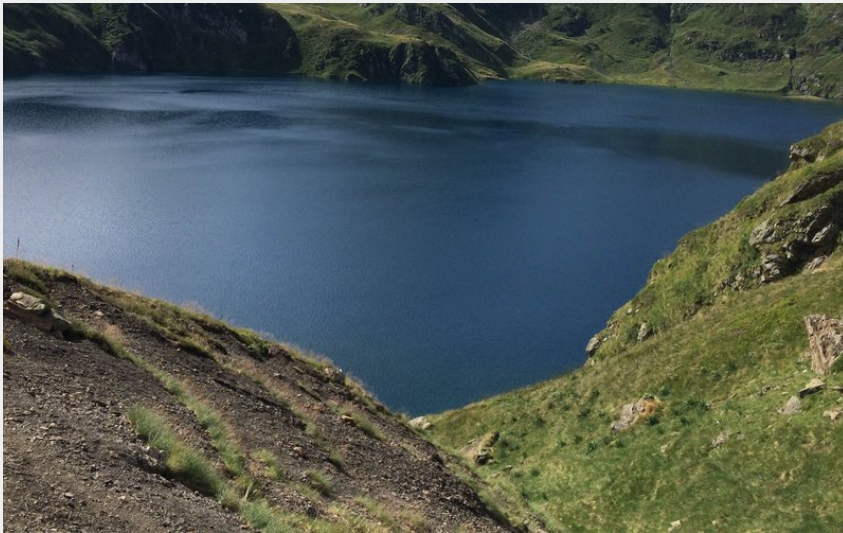
Lac bleu (OTTPM)